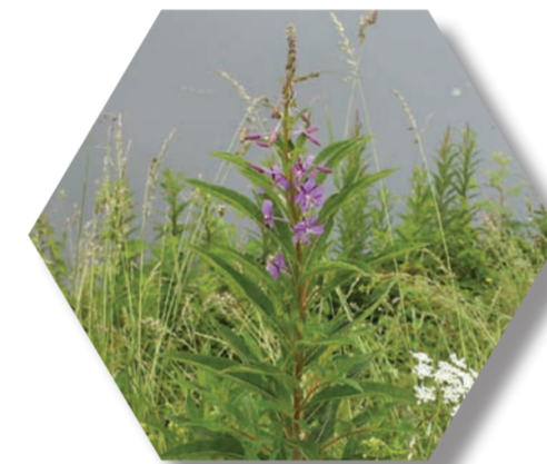
Épilobe en épi ( Epilobium angustifolium )