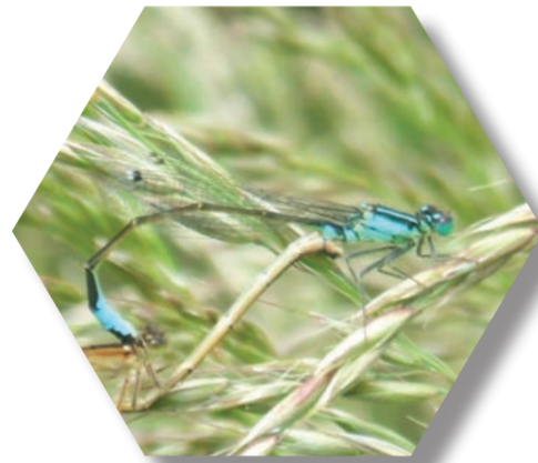
Agrion jouvencelle ( Coenagrion puella )

Voici quelques unes des nombreuses espèces susceptibles de vivre au cœur de la Deûle et de ses lagunes :