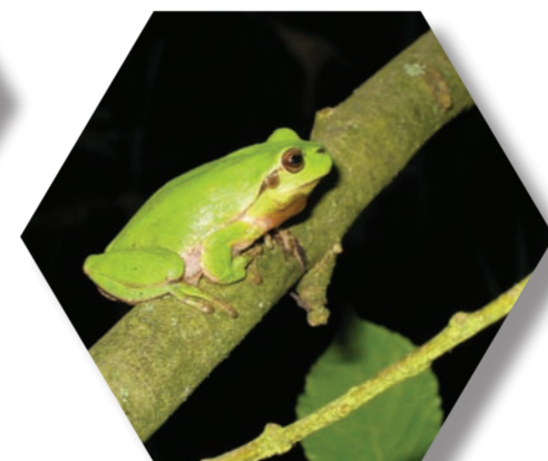
Rainette verte ( Hyla arborea )