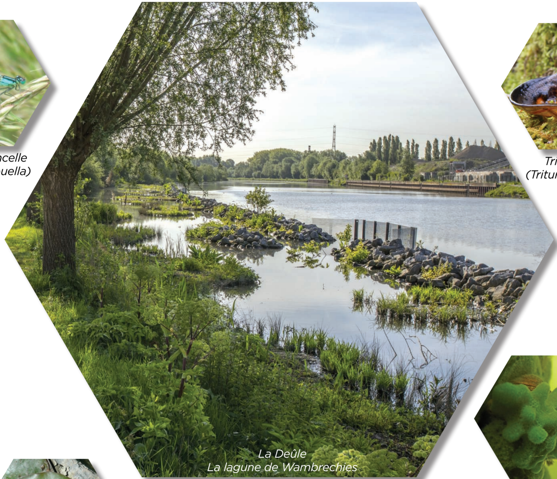
La Deûle La lagune de Wambrechies