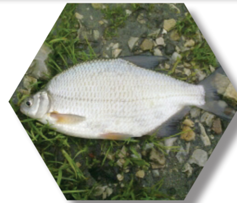
Brème commune ( Abramis brama )