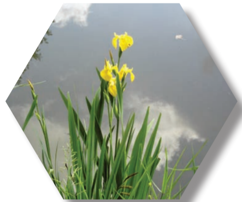
Iris des marais ( Iris pseudacorus )