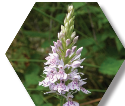
Orchis tacheté ( Dactylorhiza maculata )