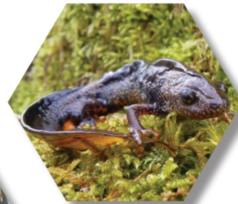
Triton crêté ( Triturus cristatus )