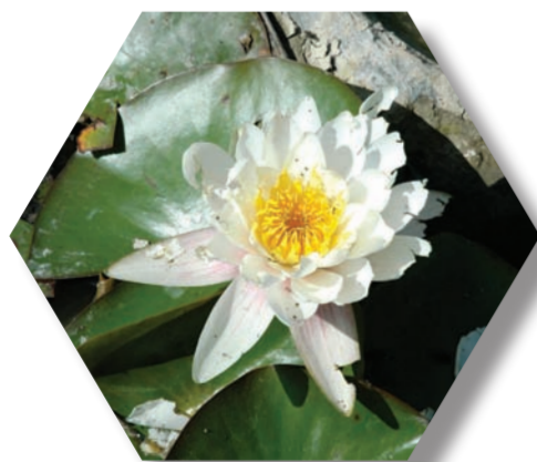
Nénuphar blanc ( Nymphaea alba )