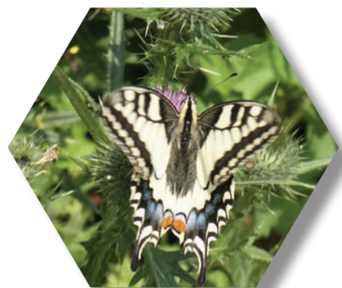
Machaon ( Papilio machaon )